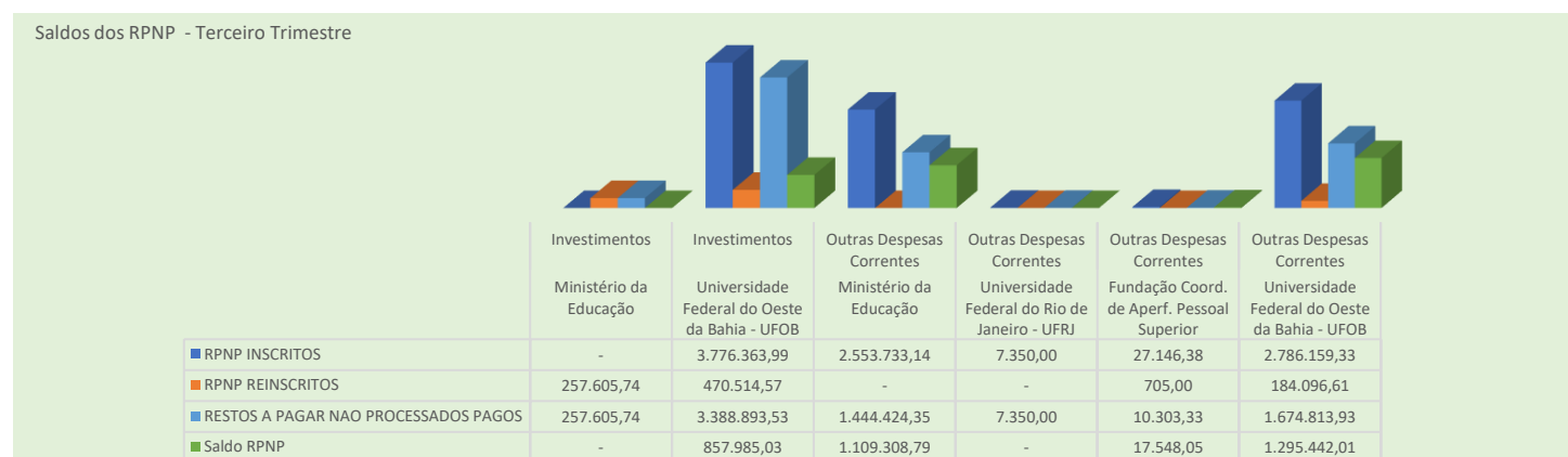
Figura 04 – Saldo RPNP 2022