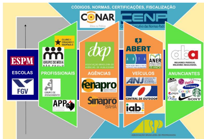
Fig. 3 - Campo da Publicidade e Propaganda: seus agentes e respectivas instituições de legitimação da profissão. (CANESSO, 2014)

A Associação Brasileira de Propaganda (ABP), apesar de criada em 1937, não tinha critérios claros de admissão e seus associados eram pessoas físicas e jurídicas. Ao lado da Associação dos Profissionais da Propaganda (APP), exclusivamente voltada ao mercado de São Paulo, cuidava basicamente da organização de eventos da área, a exemplo do Dia Mundial da Propaganda. Seu papel foi importante na formação dos profissionais que atuavam ou desejavam atuar neste mercado. Foi esta Associação, ao lado das Organizações Globo, que contribuiu com a fundação da unidade da Escola Superior de Propaganda e Marketing (ESPM) no Rio de Janeiro.