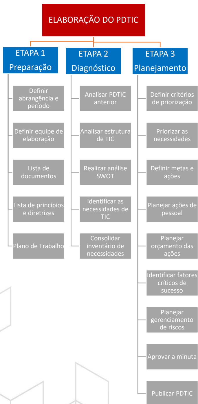
Figura 3 - Detalhamento do processo de elaboração do PDTIC

A Figura 3 apresenta as atividades da elaboração do PDTIC.