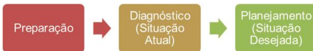
Figura 2 - Processos da elaboração do PDTIC

O macroprocesso de elaboração do PDTIC é subdividido da seguinte maneira: